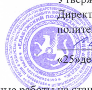
График занятости мастерской по компетенции «Фрезерные работы на станках с ЧПУ» на 2 полугодие 2020-2021 учебного года