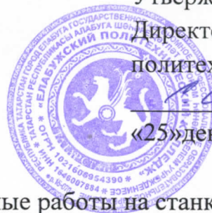
График занятости мастерской по компетенции «Токарные работы на станках с ЧПУ» на 2 полугодие 2020-2021 учебного года